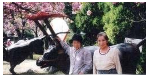
昨年も倶利伽羅へ花見に行きました(上)