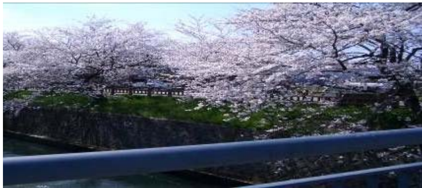
岸渡川堤の桜並木(上)