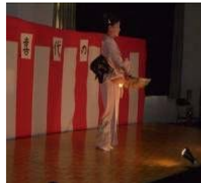
歌謡舞踊の達人 いよっ！！ 日本一！！