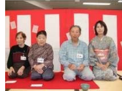
綺麗に撮ってよ その1