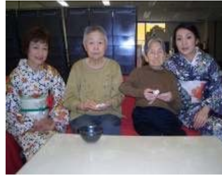
綺麗に撮ってよ その2