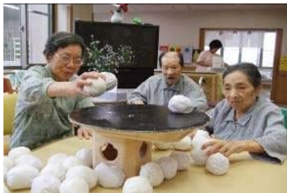
お月見ゲーム！いっばあああいこと 積まんまいけ！