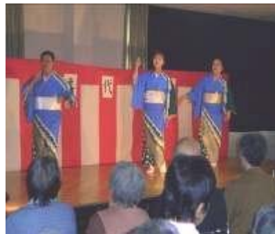
お揃いの着物 美しいです！！