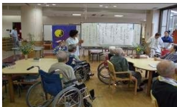
出た～出た～月が～♪まあるいまるい まんまるい～♪